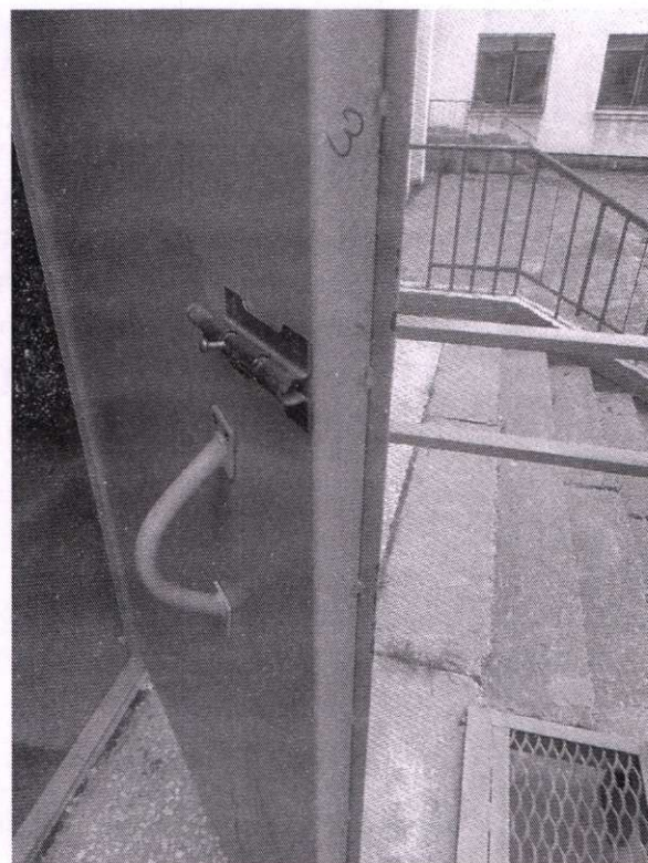
Фото 3,4 обеспечение возможности свободного открывания запоров дверей эвакуационных выходов изнутри без ключа.

Фототаблицу составил: инспектор ОНДиПР города Северодвинска и Онежского района старшина внутренней службы 02.06.2020