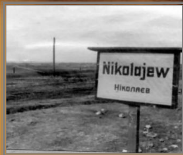
Город Николаев, оккупированный фашистами