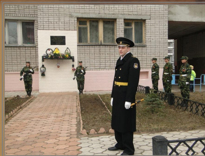
Митинг 8 мая 2014 года