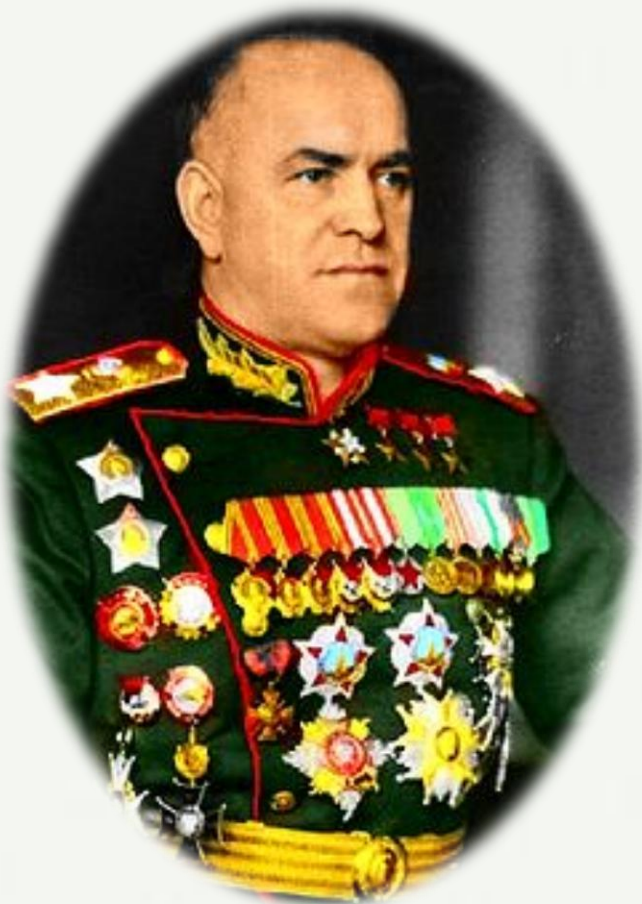
Жуков Георгий Константинович