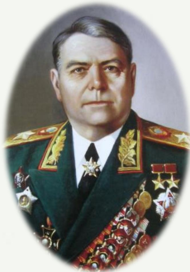
Василевский Александр Михайлович